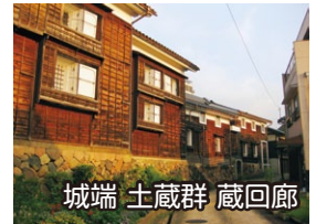
城端 土蔵群 蔵回廊