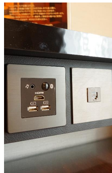
【マルチメディアハブ】