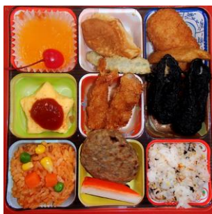
「ナイトミュージアム弁当」

「株式会社ハトヤ瑞鳳閣」による1日限りの特別メニューです。お子さまのお弁当にはヒトデをあしらったオムレツのほかオリジナルのウメテツカード付きです。また、大人向けのお弁当はちらし寿司や鱈塩焼きといった春らしい彩り豊かなメニューがそろいます。