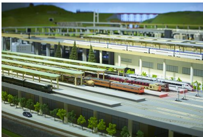
幅約30m・奥行約10mの迫力ある鉄道ジオラマ

実物車両の約1/80スケールで車両基地などの鉄道に欠かすことのできない施設を再現した幅約30m奥行約10mの巨大なジオラマです。係員が運転する鉄道模型の走行を通じて鉄道システム全体を楽しむことができます。