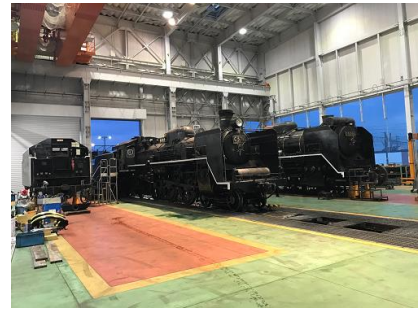
蒸気機関車の検査修繕に特化した専用検修庫で実際に作業する姿を見学しながら解説します