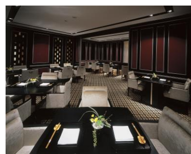
ホテルグランヴィア京都 日本料理「浮橋」