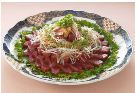
枕崎産ぶえん鯉のカルパッチョ