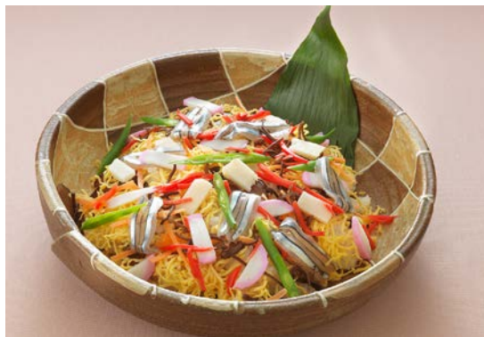
さつますもじ（ランチ限定）