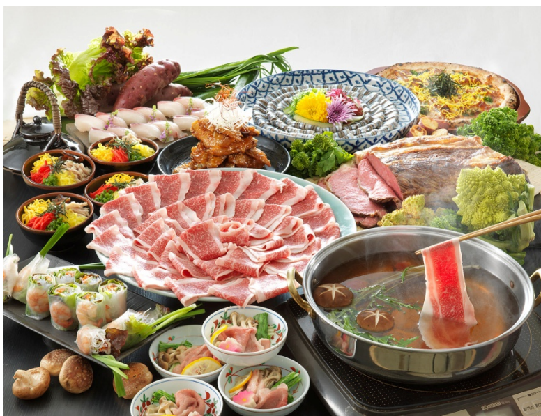
ディナーバイキング イメージ

多彩な料理が並ぶ大きなbuffetカウンターには、定番のおばんざいコーナーやローストビーフに加え、「枕崎産ぶえん鯉のカルパッチョ ゆず胡椒風味」、「鹿児島産きびなごの唐揚げ」、「鹿児島直送さつま揚げ」「さつますもじ（鹿児島風ちらし寿司）」など鹿児島食材や郷土料理をランチ&ディナー共通でご用意いたします。