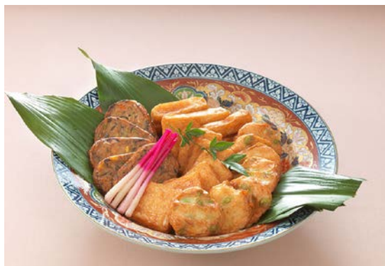
鹿児島直送さつま揚げ