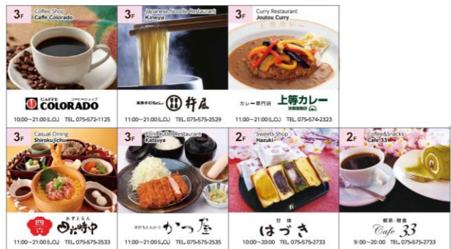
キャンペーン割引対象店舗