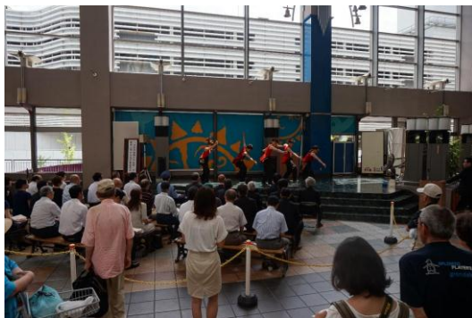
ステージイベント

「ちょこっと関西歴史たび 醍醐寺」の開催にあわせて、地下鉄醍醐駅上の商業施設(パセオ・ダイゴロー)では、施設内の飲食店を利用された場合に10パーセント割引キャンペーンやステージ企画などのおもてなしイベントを実施します。