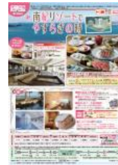
パンフレットイメージ

その他詳細な商品内容については、主な駅に設置しているパンフレットやホームページをご覧ください。