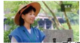
語り部映像ガイド