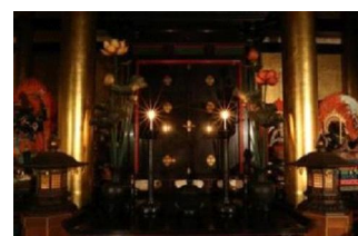
金堂 御本尊特別開帳