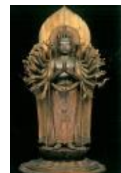
補陀洛山寺御本尊