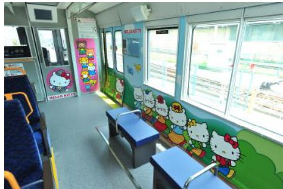
©1976, 2014 SANRIO CO.,LTD. APPROVAL No.G551661