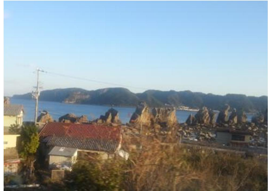
橋杭岩(紀伊姫～串本駅間)