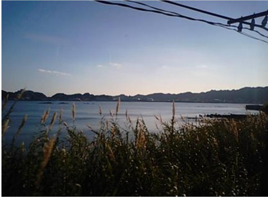
那智湾(宇久井～那智駅間)