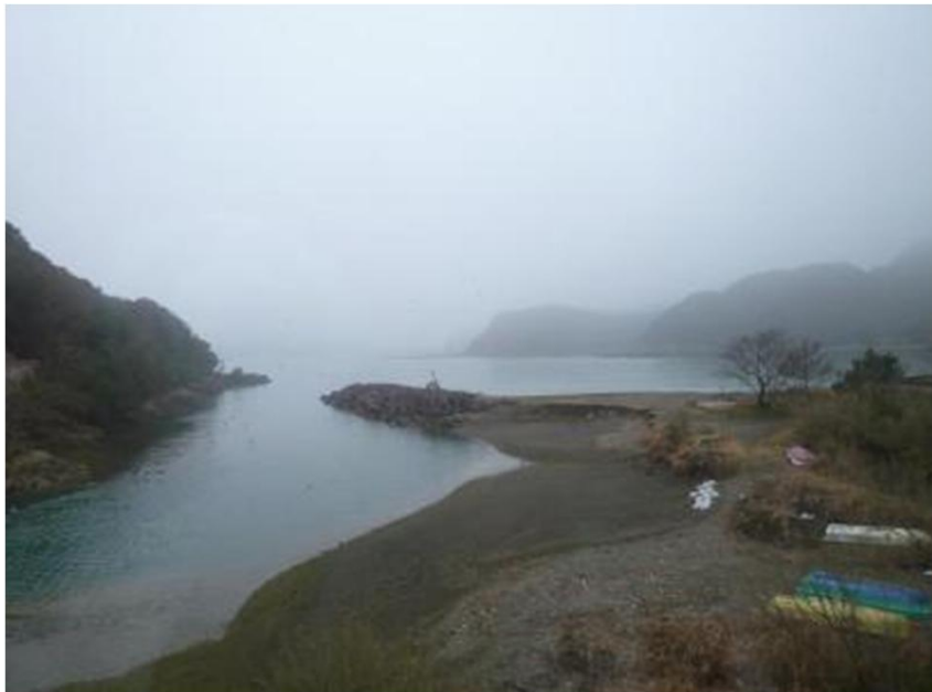
湯川海水浴場(湯川駅)