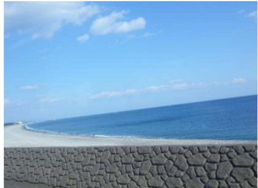
王子ヶ浜(新宮～三輪崎駅間)