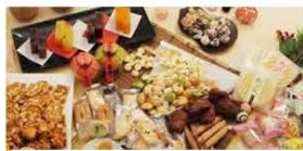
Tales of sweets that give you a big smile