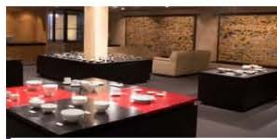
Learn about Japanese culture through Kyo-yaki and Kiyomizu-yaki