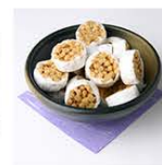
[Wagashi Sweets] JP¥ 315 US$ 3.98