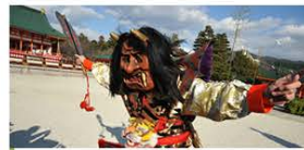
Various setsubun parties that keep the spirits before spring comes