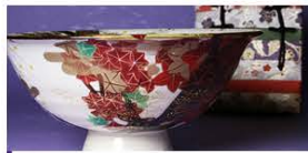
Beauty and originality become visible through repetition