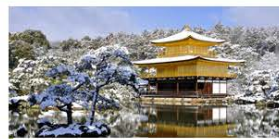
The charm of Kyoto, traditional & innovative