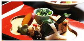
Japanese foodtraditional food culture of Japan