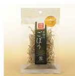
Shredded Burdock Root 15g JP¥ 250 US$ 3.16