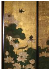
建仁寺正伝永源院