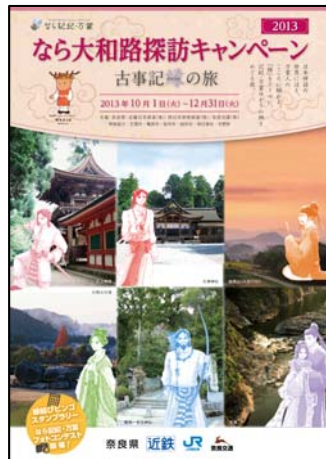
専用パンフレットイメージ図

近鉄およびJR西日本の主な駅や、天理市、橿原市、桜井市、御所市、明日香村、吉野町（これらを総称して、以下「キャンペーン実施エリア」）の観光案内所等に設置します。