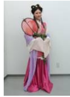
古代衣装をまとった劇団員