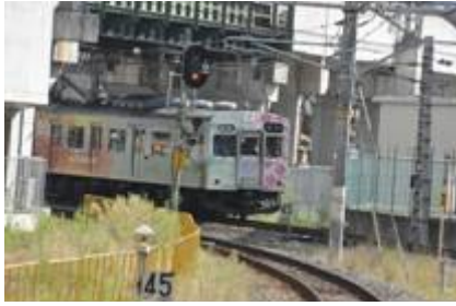
ラッピング列車写真