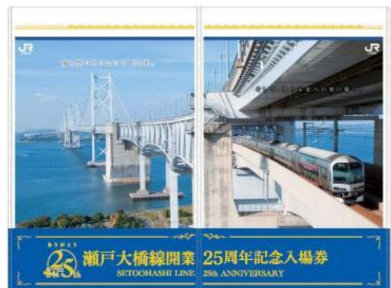
両方の入場券の台紙を合わせたイメージ