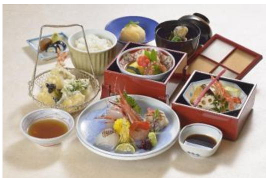
瀬戸大橋線開業25周年・スペシャルランチ