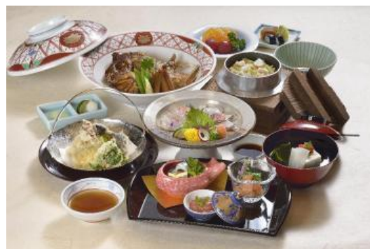
瀬戸大橋線開業25周年・鯛づくしディナー