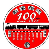
ヘッドマークデザイン