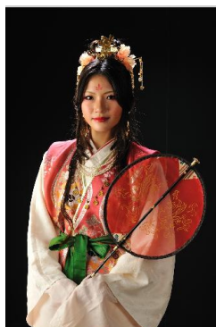
劇団員による古代衣装 (イメージ)

※天候不順等により、列車乱れや運行不能が発生した場合、イベントを中止する場合がございます。