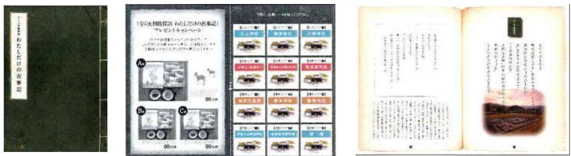
冊子「なら大和路探訪 わたしだけの古事記」 (イメージ)