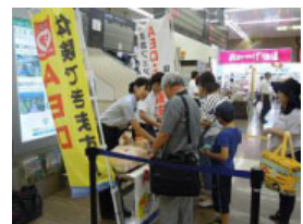
7/27(金)新幹線 J R 広島駅での様子