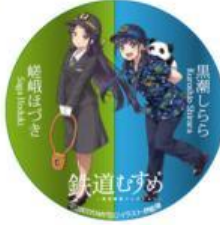
デカ缶バッジ2種 (ツートン) 全2種