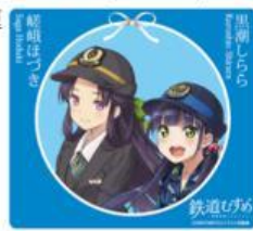
マウスパッド (ブルー) 全3種