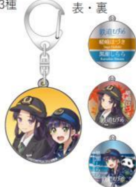
チャームキーホルダー 全3種 表・裏