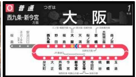
【案内ディスプレイ(画面イメージ)】