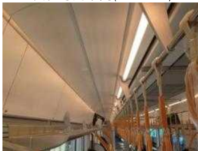
【女性専用車両(電球色LED)】