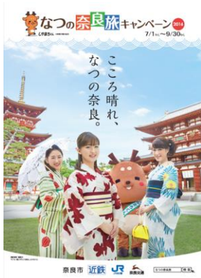
(パンフレット表紙)