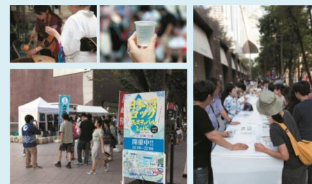
氷を浮かべたオンザロックの日本酒が楽しめる(昨年の実施写真)

「梅田ゆかた祭2016」開催に合わせ、梅田を便利で快適なまちにする交通サービス “うめぐるバス”を無料運行！ぜひ、この機会にご利用ください。