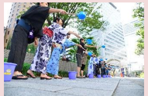
ディアモール大阪(梅田DTタワー)会場 昨年の実施写真