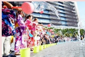
グランフロント大阪会場