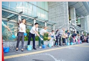
大阪ステーションシティ会場