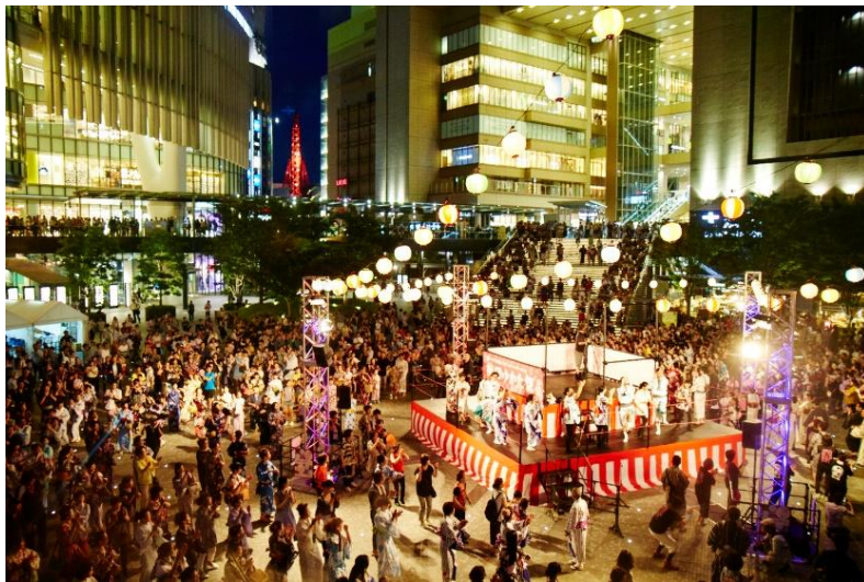
【昨年のゆかたde盆踊りの様子】

※1. 梅田ゆかた祭2016実行委員会:梅田地区エリアマネジメント実践連絡会、大阪市、株式会社カクタス(事務局)より構成。 梅田地区エリアマネジメント実践連絡会について