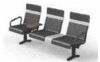
導入タイプの一例