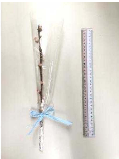
配布する「桃の花(切り枝)」のイメージ [約30cm]

『大阪環状線改造プロジェクト』では、駅の特徴などに合わせ、各駅のシンボルフラワーを定めています。桃谷駅のシンボルフラワーは「桃の花」です。