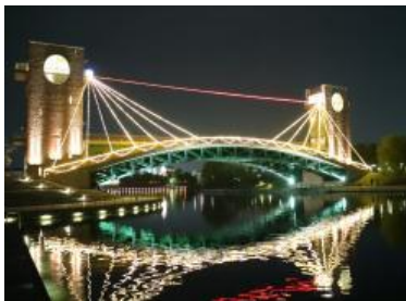
富岩運河環水公園

※9月17日(土)～11月27日(日)の土日祝、17:00～20:30 実施(最終入園は20:00 まで)