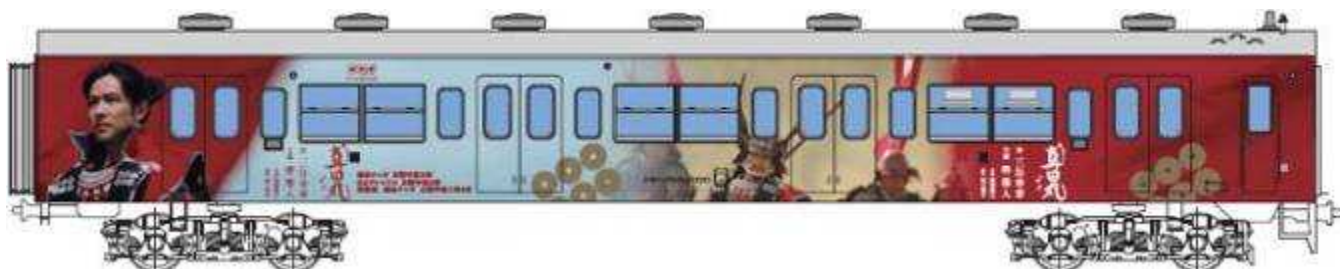
和歌山線105系先頭車(イメージ)