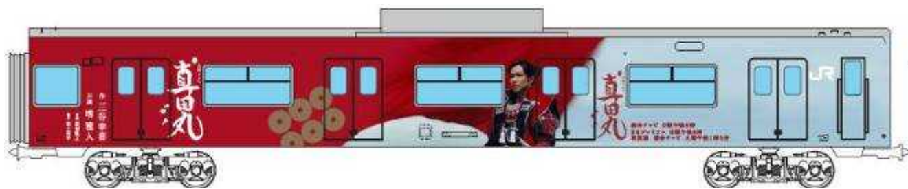
大阪環状線201系先頭車(イメージ)

好評展開中のチェックインラリーも合わせ、この機会にぜひ「真田信繁(幸村)」ゆかりの地へおでかけください。