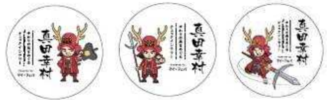
(オリジナルマグネット イメージ)