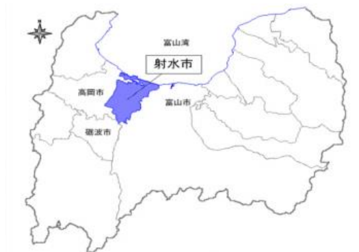
養殖場所：富山県射水市内

伏流水と水深 100m から汲み上げた海水を使って陸上養殖することにより、寄生虫が付きにくく新鮮なまま生で召し上がって頂けるほか、サケ科特有の臭味が少ないのが特長です。また、伏流水を使って陸上養殖することにより、稚魚が海水に適用できるようになる銀化（ぎんけ）現象が起きやすいため早くサクラマスになり、養殖期間 1 年半程度で春から出荷できます。