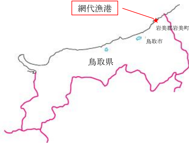
鳥取県岩美郡岩美町大谷 2182-484 の一部（網代漁港内）