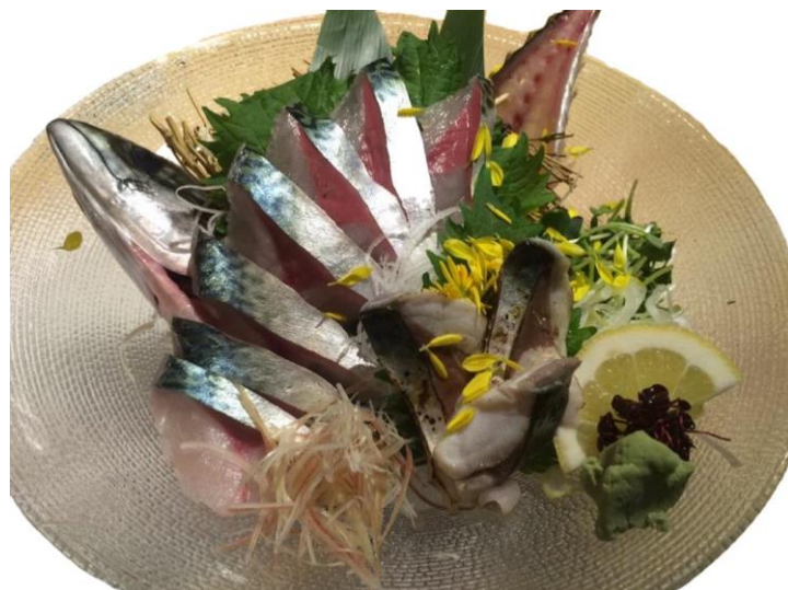
調理イメージ：「お嬢サバ」の姿造り