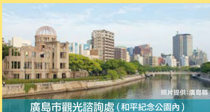
廣島市觀光諮詢處 (和平紀念公園內)