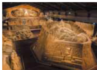
※照片为2016年展示的情形。