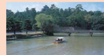
Gurutto松江护城河游览船