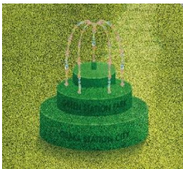
5층 '도키노히로바 광장' 공원을 이미지한 오브제