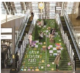
노스게이트 빌딩 3층 '대계단'