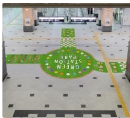
노스게이트 빌딩 1층