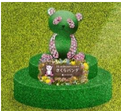
다이마루·마쓰자카야 공식 캐릭터 '사쿠라 팬더'