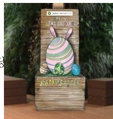
부활절 포토 스팟