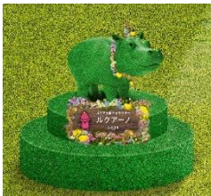
Lucua osaka 캐릭터 '루쿠아노'