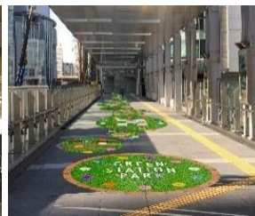
사우스게이트 빌딩 동쪽 2층 '스카이워크'