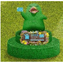
ICOCA 마스코트 캐릭터 '오리너구리 이코짱'