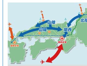
関西空港の外国人入国者数 (全国との比較)