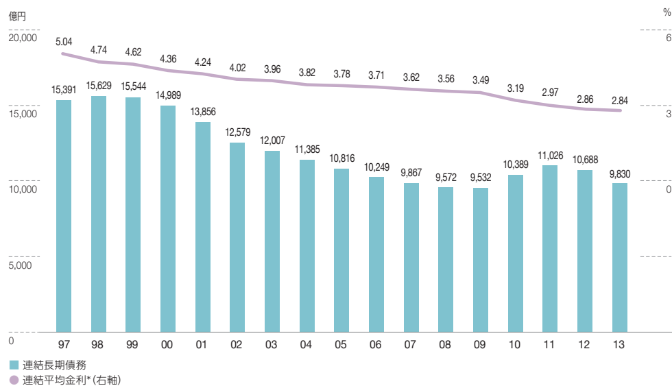
■ 連結長期債務残高の推移 各年3月31日現在