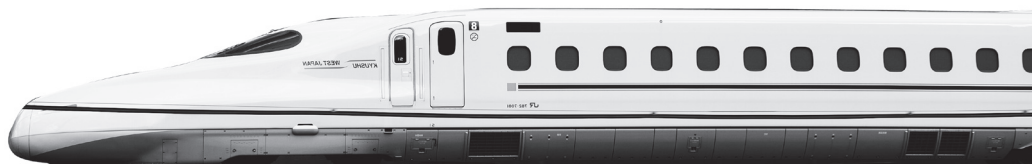
九州新幹線直通運転用車両