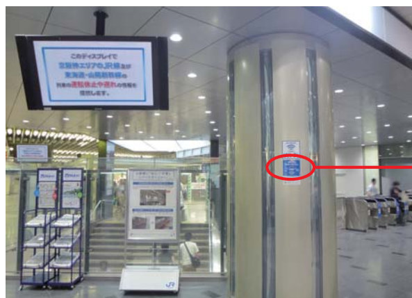
駅のサービス提供箇所にはステッカーを貼付

大規模災害が発生した時には、必要な情報が取得できる環境を提供し、早期避難や被害の最小化を図るため、すべてのお客様にインターネットを無料開放します。