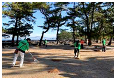
大元公園（岡山）の清掃活動の様子