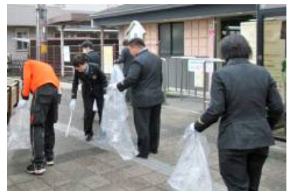
茶道石川流発祥のお寺として有名な慈光院（奈良）までの参道の清掃活動の様子