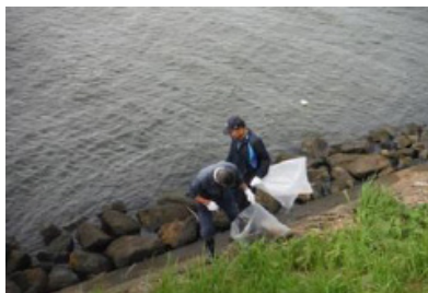
ラムサール条約湿地に登録されている中海・央道湖（島根）での清掃活動の様子