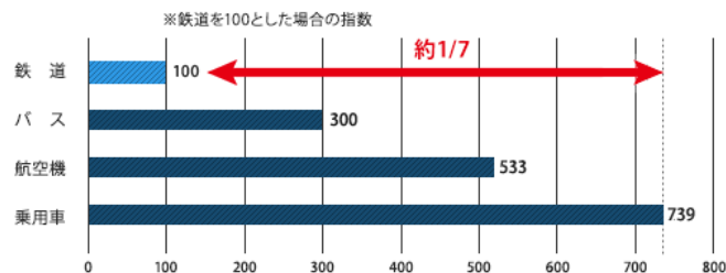
単位輸送量あたりのCO 2 排出量【旅客】（2018年度）

（注）国土交通省ホームページをもとに作成（ ）は、実際のCO 2 排出量 [g-CO 2 /人キロ]