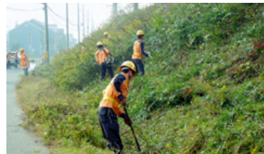
豊岡地区では、ホタル等の生物が生息しやすい環境の保全のために、側溝の清掃や、のり面等の除草を地元の方々と合同で実施しました。

当社の事業エリアには、希少生物を含む多種多様な生物が生息する豊かな自然があります。地域とともに生きる企業として沿線の自然を守ることは大切なことととらえ、事業活動と生物多様性の関わりを知るとともに、工事着手前に調査を行ったり、社員やその家族、OB、グループ会社が湖や河川の清掃活動に参加したりすることで、様々な生物が生息する自然環境を保全に努めています。