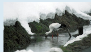
線路近くの水路に姿を現したコウノトリ