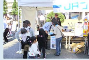
関西橋正展でのパンフレット配布の様子

また、隣接する中学校の体験学習時には、JR西日本の環境への取り組みの説明を実施し、環境保全の必要性を少しでも多くの生徒に理解していただいたり、地域のイベントにも駅として参加し、駅をご利用になられるお客様以外へ鉄道のエコについてご理解いただけるような取り組みを展開しています。