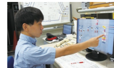
手動制御の場合でも安全に信号を制御