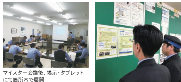
マイスター会議後、掲示・タブレットにて箇所内で展開