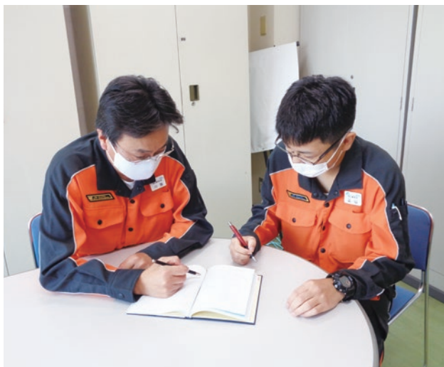
「安全の誓い」で具体的な考動の振り返りとサポートを行う川端区長(左)と込山社員(右)