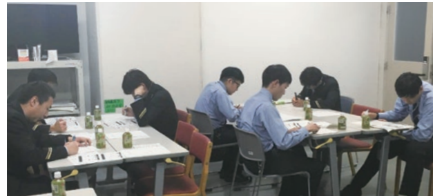
列車や駅間、環境のファクターを組み合わせたヒヤリハットとそれに対する対処のポイントについて議論