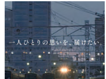
新たに放映した企業CM

当社の鉄道が社会インフラとして人々の生活をお支えていること、その中で当社グループの社員一人ひとりが鉄道の安全安定輸送の実現に向け努力していることを表現した動画を作成し、TVCMを中心に当社ウェブサイトやYouTube等でも放映しています。