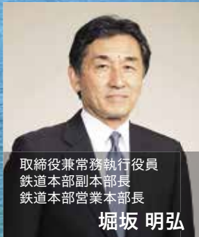
取締役兼常務執行役員 鉄道本部副本部長 鉄道本部営業本部長