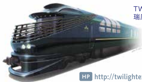
TWILIGHT EXPRESS 瑞風 車両イメージ

日本海や大山、瀬戸内海の多島美などの車窓からの景色をお楽しみいただくとともに、沿線の途中駅に立ち寄り、地域の歴史や文化に触れていただきます。