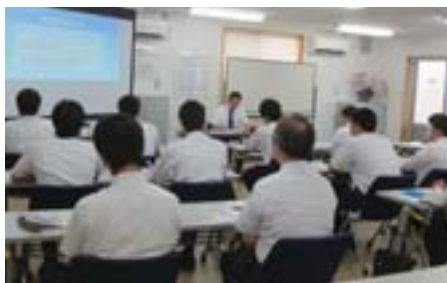
事故現場での研修

加えて、被害に遭われた方々への対応を行ってきた社員が中心となって、事故の悲惨さなどについて語り継ぐことを目的に特別講義を実施しています。また、ご被害者に直接講話していただき、その講話を収録したDVDを視聴するなど、社員がご被害者のお声やご意見をお聞きする機会も設けています。さらに、社員一人ひとりがこの事故の重大性や安全の重要性を一層強く認識するため、弊社社員およびグループ会社社員が自主的に事故現場を訪れて献花を行っているほか、献花台の前に立哨して献花を訪れる方々をお迎えする取り組みも継続しています。