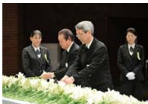
献花をする弊社役員