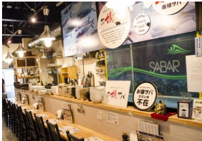
サバ料理専門店「SABAR」大阪南森町店