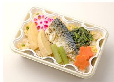
淡路屋特製駅弁「お嬢サバ」のホカホカ華やぎ弁当 1,138円(税込) (「サバの日」のイベント 40 個限定)