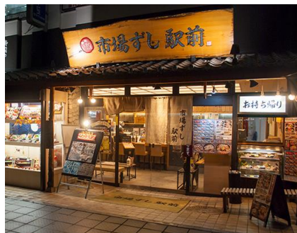
中央市場 駅前 市場ずし駅前 兵庫中店