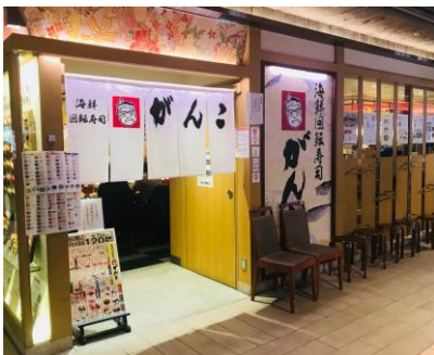
回転寿司がんこ エキマルシェ大阪店