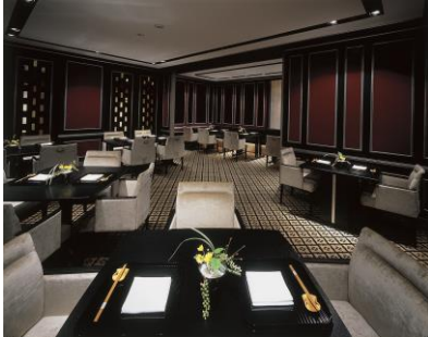
ホテルグランヴィア京都 日本料理「浮橋」