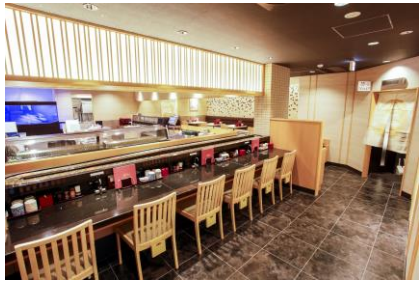
活魚廻転寿司 CHOJIRO 法善寺店