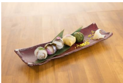
鯖や特製「お嬢サバ」のてまり寿司 880 円(税込)