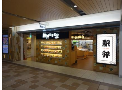
新大阪駅 旅弁当駅弁にぎわいアルデ新大阪店