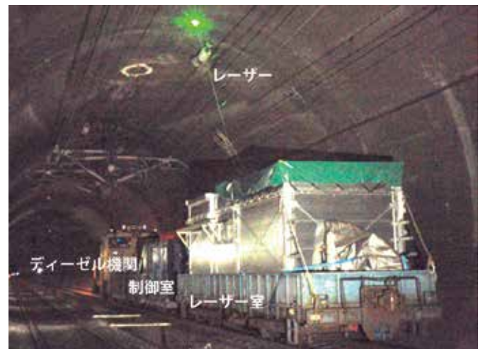
図2：新幹線トンネル内でのコンクリート剥離検知実験（保守用車型）

レーザー制御およびデータ収集を遠隔で操作できるように制御室を設けました。本装置によりレーザー計測が可能となり、レーザーリモートセンシングを用いた手法がトンネル内の振動・騒音環境下における使用に耐えられる可能性を示唆しました。