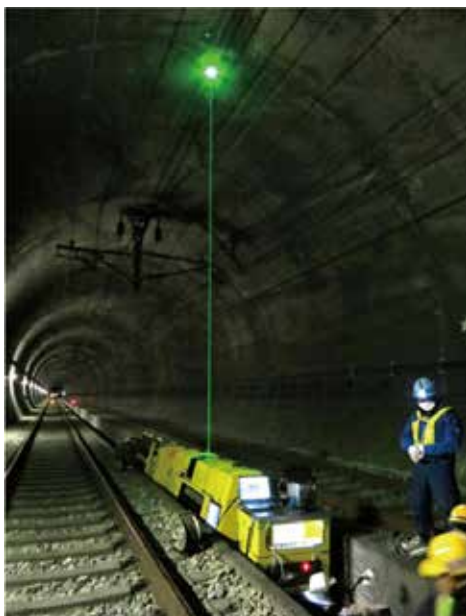
図4：新幹線トンネル内でのコンクリート剥離検知実験 (中央通路走行型)