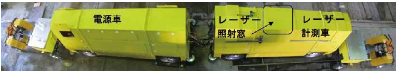
図3：中央通路走行型のレーザー計測車両

レーザーリモートセンシングを用いたコンクリート剥離検知を実現するためには、上記以外にも大きな技術的課題があると考えています。今後、取得データを積み重ねて課題を把握・克服し実用化することにより、さらに安全・安心な鉄道を築きたいと考えています。