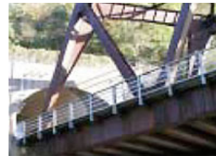
耐候性鋼材を使用した橋梁