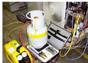
フロンガスの回収

現在、車両や建物の空調機などに冷媒としてフロンガスを使用しています。そのうちCFC（クロロフルオロカーボン）とHCFC（ハイドロクロロフルオロカーボン）は、太陽が発する強力な紫外線から地球を保護しているオゾン層を破壊する物質として「オゾン層保護法」によって使用が規制されています。これらの物質を、よりオゾン層に与える影響が少ない物質に転換するとともに、空調機のメンテナンスや廃棄の際には大気への放出を防止するために専用の回収器を使用し、オゾン層保護に努めています。