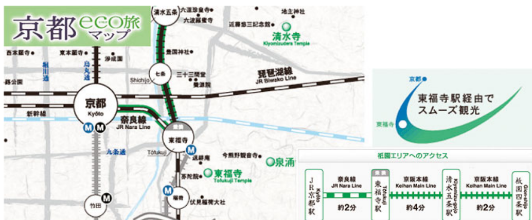
「駅からecoマップ」（京都eco旅マップ）：図はJRと京阪電車を利用した観光マップの例

公共交通機関の利用促進は、交通体系としてのCO 2 排出量の削減につながることから、国による「運輸部門のCO 2 排出削減対策」のなかでも重要な施策と位置づけられています。当社においても、その方向に則り、鉄道を中心とする公共交通の利用促進に向けて、他の交通事業者と連携して取り組んでいます。さらに、駅まで・駅からの移動手段や鉄道のご利用がエコへの参画だと実感できるライフスタイルを提案し、お客様と一体となった取り組みを推進しています。